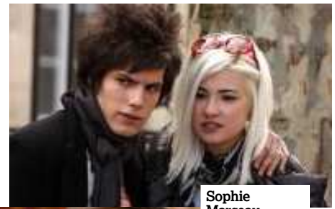
Sophie Marceau interpreta a la madre de una adolescente (Christa Theret) en el filme LOL .

La vida de una familia con hijos menores de edad está pausada por el calendario escolar. Por esa razón, LOL (sigla de Laughing Out Loud , o muerto de risa , expresión supuestamente popular en el internet adolescente) comienza con la vuelta de septiembre a las aulas, para desarrollar, trimestre a trimestre, los encuentros y desencuentros, los enredos sentimentales (te quiero, no te quiero, no sé si te quiero...) y hasta el consabido viaje de estudios (a una anodina Británica de tebeo) propios de los tiempos de instituto. LOL es, también, como los amigos llaman a Lola ( Christa Theret ), la hija mayor de Anne ( Sophie Marceau ), madre divorciada que intenta educar con tanta autoridad como cariño y mano izquierda, si bien no puede evitar que sus propias adolescencias (se sigue viendo con su ex, fuma porros a escondidas) salgan a la luz. Ese es uno de los aciertos del filme, la idea de que el pavo no es una edad, sino un estado en el que caeremos sucesivamente, sin solución, a lo largo de nuestras vidas. «No intento contar historias extraordinarias», confiesa la directora, Lisa Azuelos . Y hay que darle la