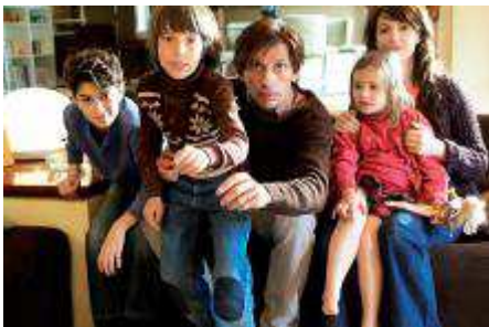
El cineasta Bezançon crea a la peculiar familia Duval.

razón. En LOL aparecen las variaciones argumentales que ya hemos podido disfrutar en multitud de películas y series de televisión (como Los Serrano o la actual Física o química ). Sin embargo, Paris is different , y la clase media francesa, más; su encanto es elegante y sus rebeldías tienen causas. Pequeñas, eso sí. ESTRENO EL 26 DE JUNIO. (MÁS INF.: ALTAFILMS.COM)